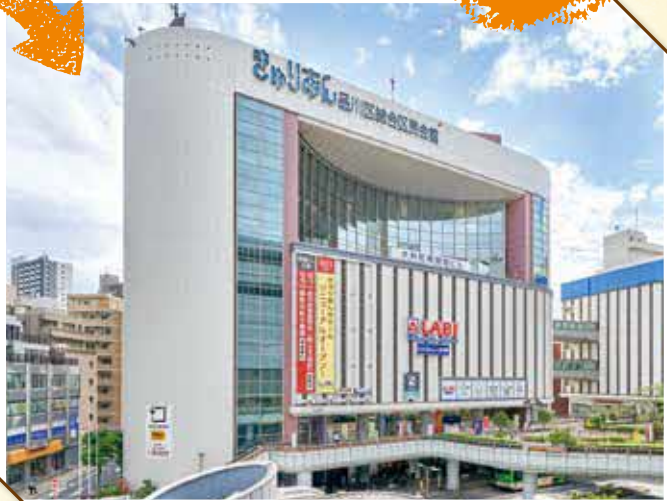
きゅりあん(品川区立総合区民会館)