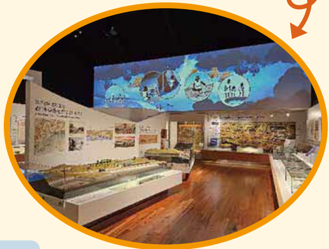
リニューアル後の常設展示室**