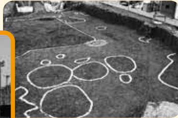
歴史館建設中に遺跡発見(昭和58年)*