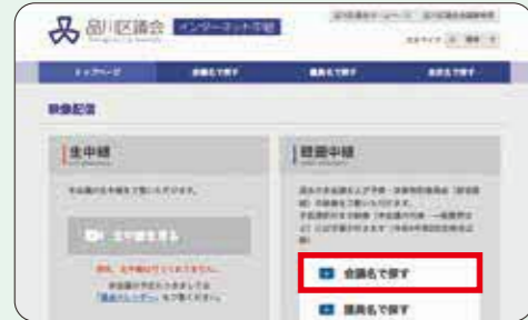
インターネット中継トップ画面 (パソコン)