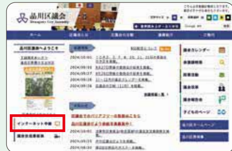
区議会ホームページトップ画面 (パソコン)