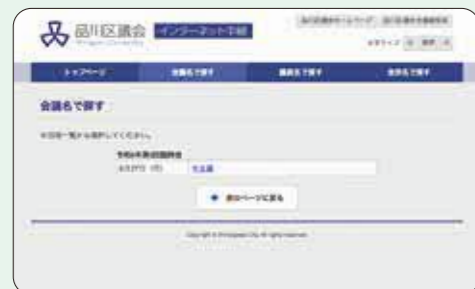
(例)「会議名で探す」の場合