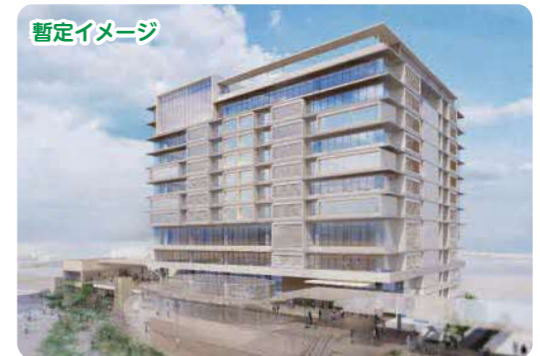
※この暫定イメージは、基本設計中間段階（令和6年1月）のものであり、今後の設計や行政協議等の進捗に応じて変更が生じます。