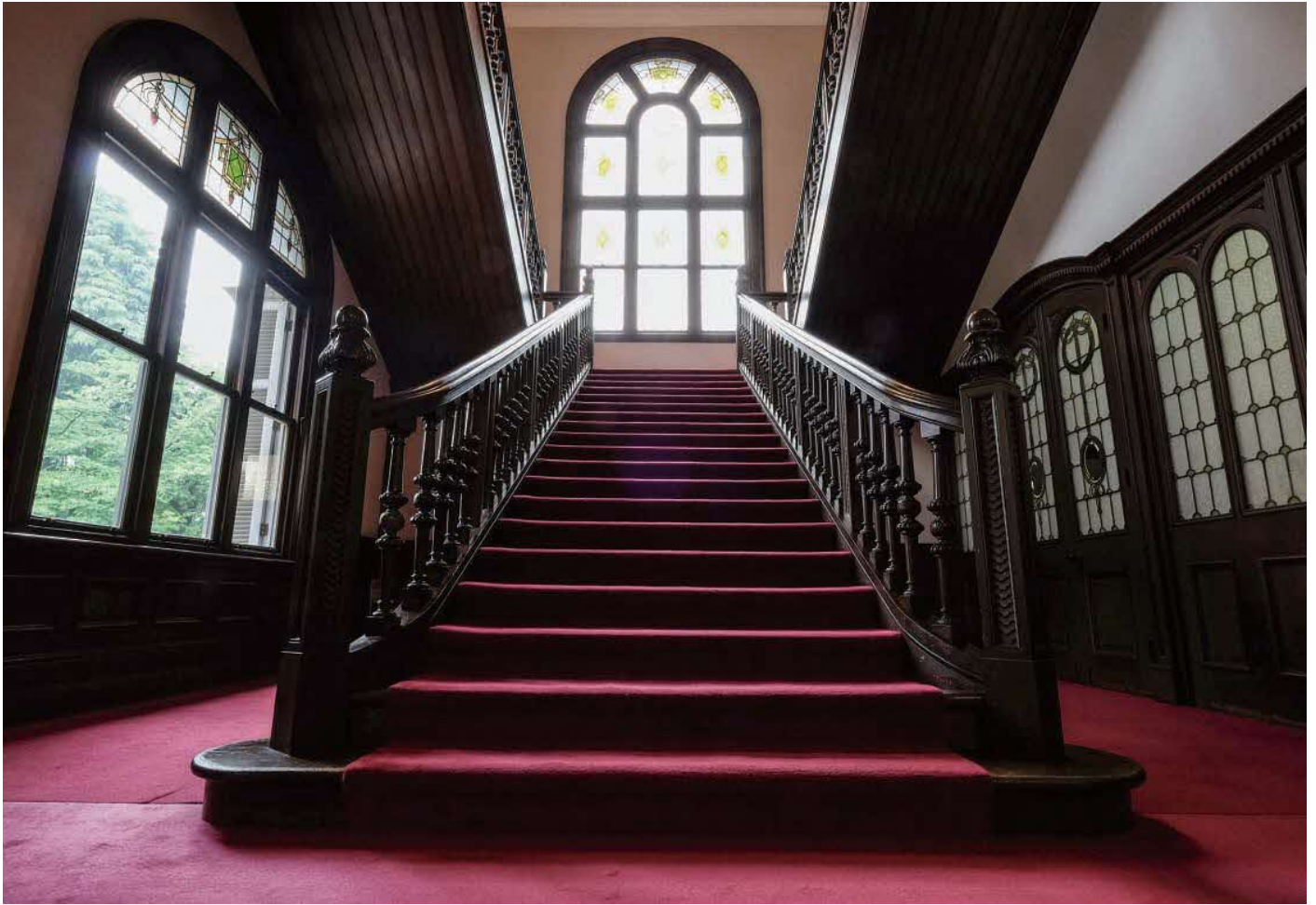
清泉女子大学 本館(東五反田三丁目)