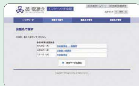
(例)「会議名で探す」の場合