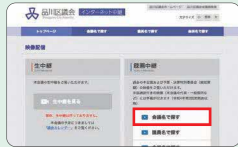
インターネット中継トップ画面 (パソコン)