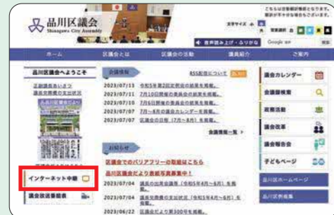
区議会ホームページトップ画面 (パソコン)