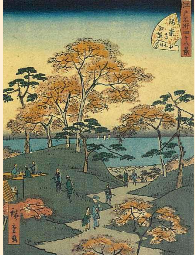
(右) 同 三十七 海案寺紅葉