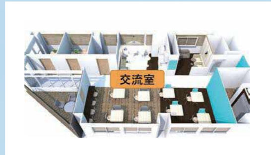
●武蔵小山創業支援センター 変更箇所イメージ図