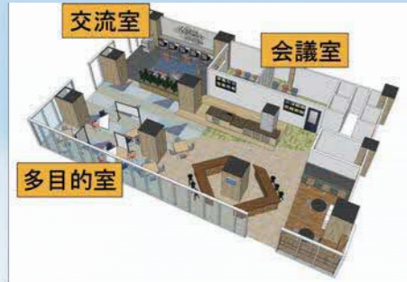
●西大井創業支援センター 変更箇所イメージ図

創業を予定する者、新分野へ進出する中小企業等の支援を推進するため、西大井・武蔵小山創業支援センターの交流室（コワーキングスペース）等を新設・拡大します。