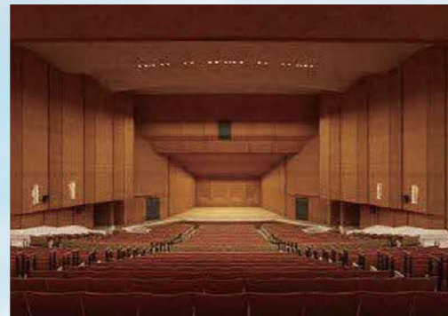
●大ホール改修後イメージ図