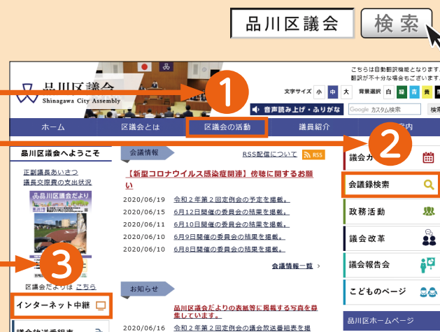
区議会ホームページ トップ画面(パソコン)

インターネット中継から、本会議の代表・一般質問等や予算・決算特別委員会総括質疑の映像をご覧いただけます。