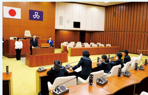
本会議場での質疑