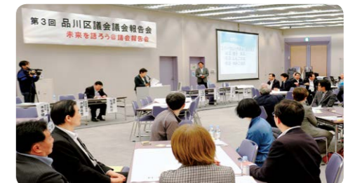
議会報告会の様子

3回目となる今回は、意見交換会の時間を増やすなどの改善を行い、「品川の魅力発見!」をテーマに、区内一斉防災訓練など、日頃、議員が気づかない視点からの意見が出されるなど、有意義な報告会となりました。また、当日は平日の夜間の開催でしたが、50名の方の参加がありました。