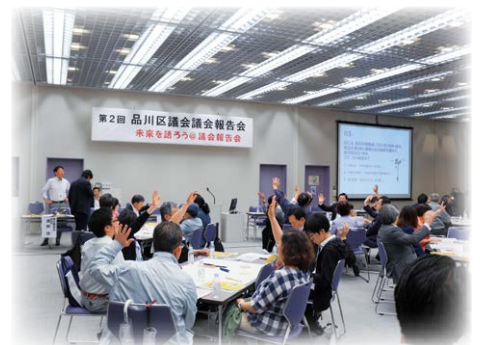
昨年の議会報告会の様子