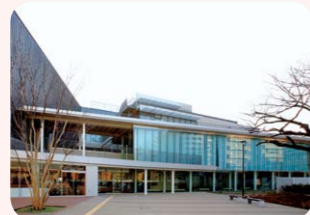
区立荏原平塚総合区民会館(スクエア荏原)荏原四丁目

公の施設の管理に民間の能力を活用しつつ住民サービスの向上を図るとともに、経費の縮減等を行うために導入されました。