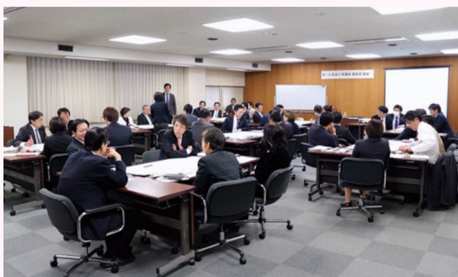
参加議員36名が8つのグループに分かれて討議、発表