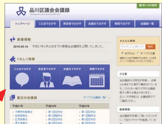
(会議録の検索画面)