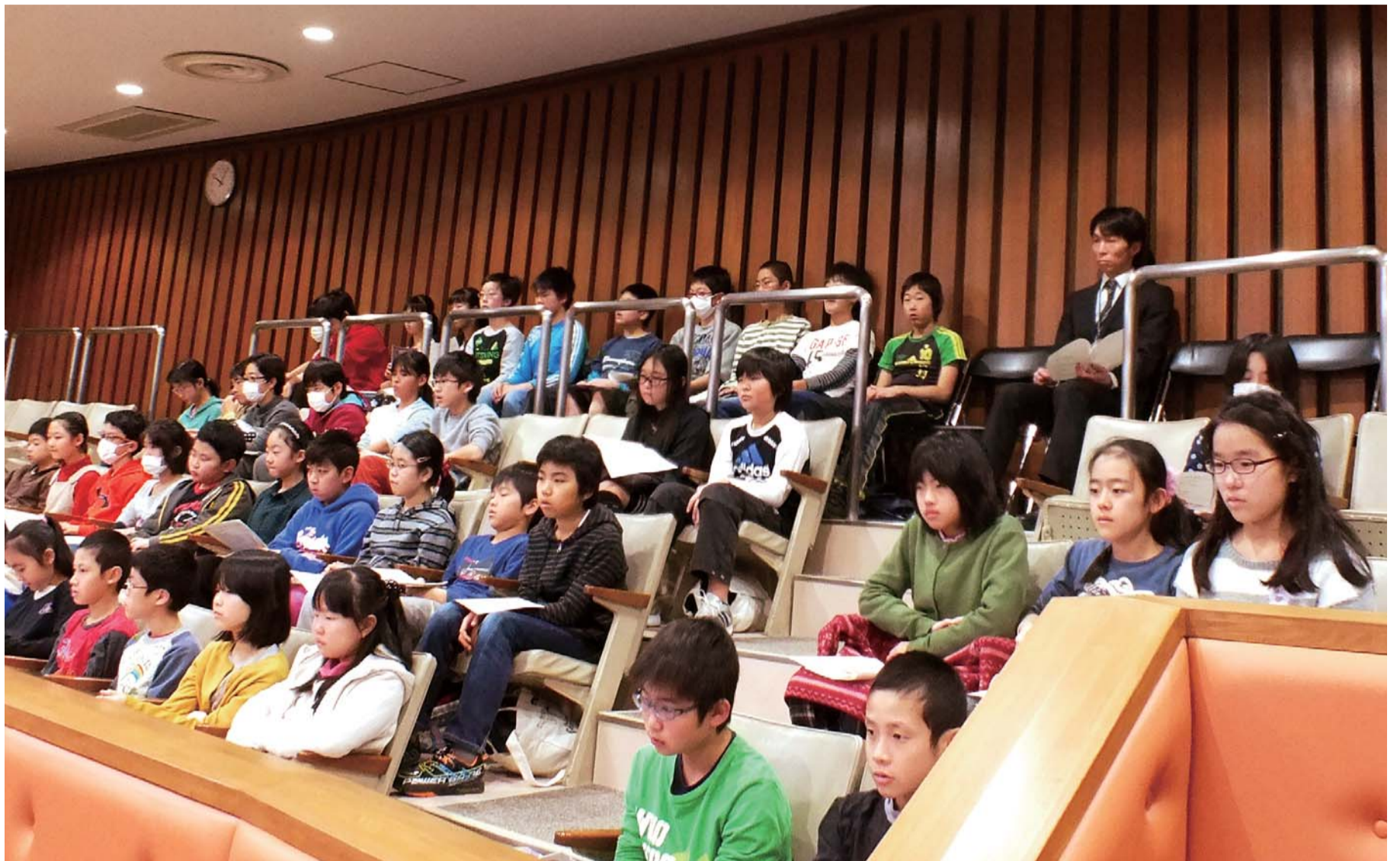
本会議傍聴(山中小学校)

No.248 平成27年(2015年)2月17日 発行 品川区議会 (〒140-8715) 東京都品川区広町2丁目1番36号 電話 3777-1111(大代表) 5742-6810(直通) 品川区議会のホームページアドレス http://www.city.shinagawa.tokyo.jp/kugikai/index.html