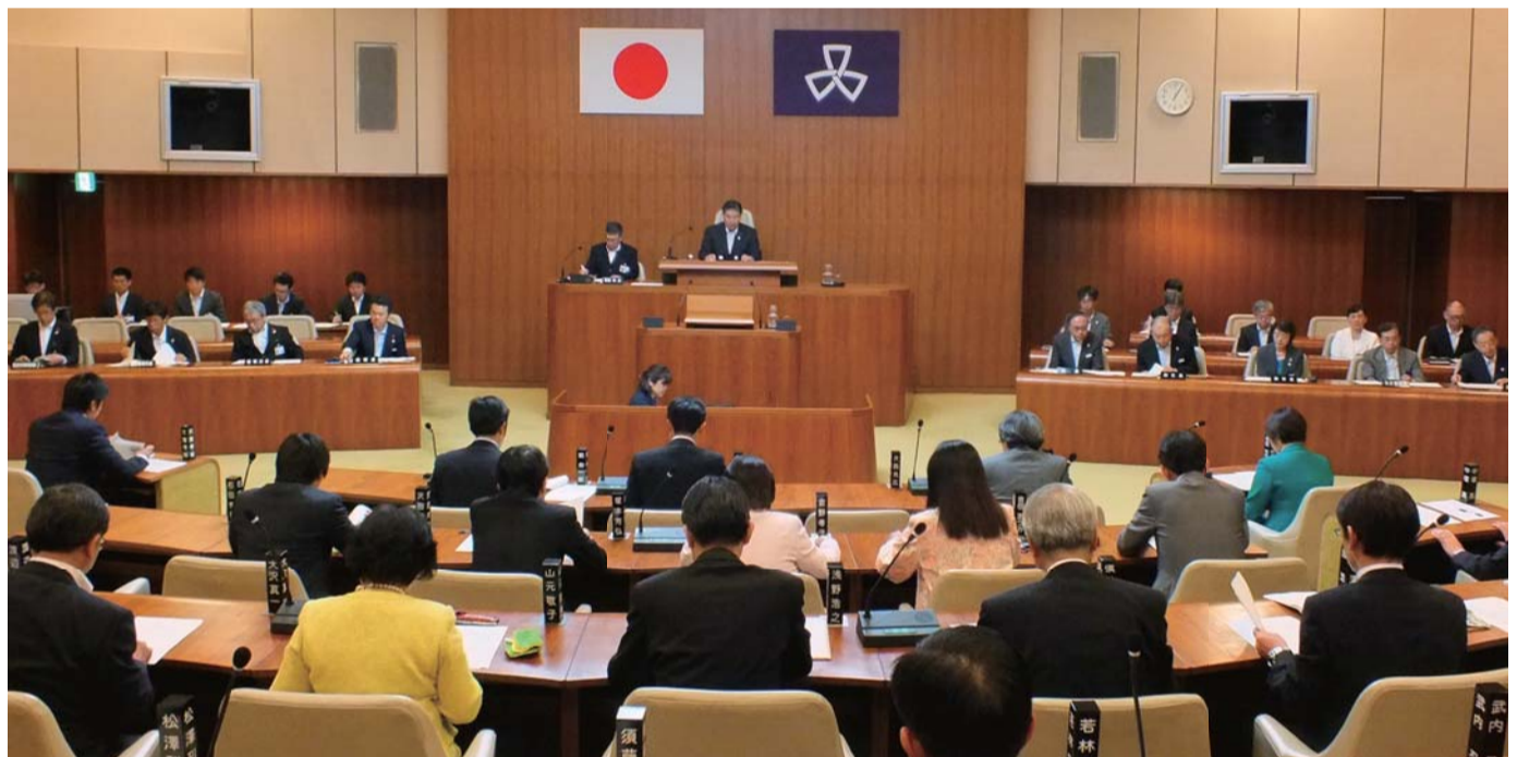
第1回臨時会の様子