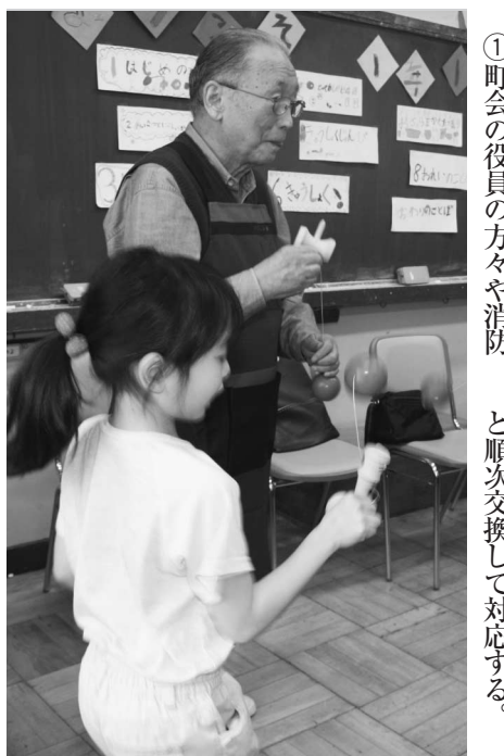
高齢者との世代間交流 城南第二小学校

①平成21年11月に行われた22年度予算要求のむだを洗い出す行政刷新会議の事業仕分けでは47事業の仕分けに取り