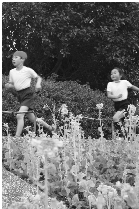
菜の花マラソン 鮫浜小学校

①1月8日に締め切った認可保育園の入園申請数と4月1日の入園可能数は。また未入園児数は。②国が最低基準を引き下げ、区がさらなる詰め込み保育を行えば、劣悪な環境がさらに悪化するのでは。③5歳児を保育園から学校に切り離すことは、子どもたちに新たな負担を押しつけるものだ。学校への移動ありきの実験をやめるべきでは。④区の待機児解消は、安上がりな保育で乗り切ろうとする内容だ。待機児は認可保育園の大幅増設で解消すべきでは。