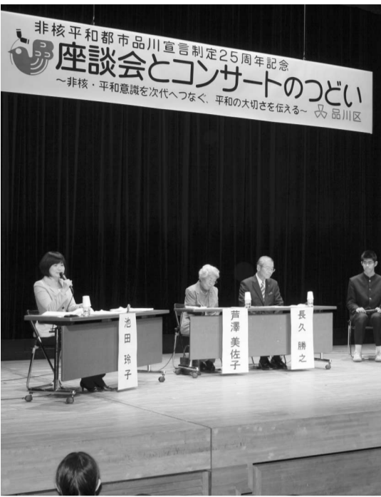
非核平和都市品川宣言制定25周年記念事業

超える受け入れ枠を確保した。② 開設等が予定されている施設の案内をしていく。③ 関係団体の意向も踏まえ、先進事例等をもとに研究を行う。