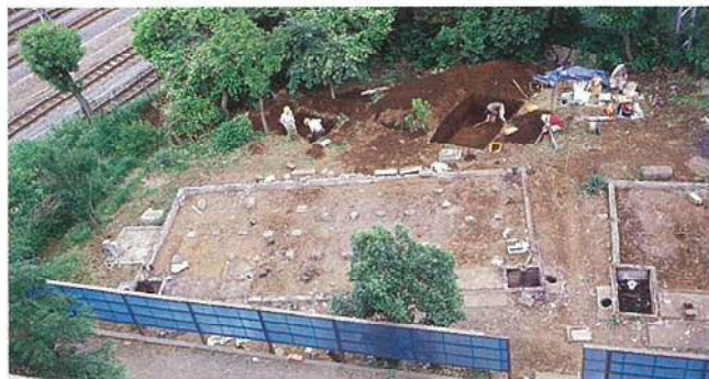
大森貝塚発掘調査風景 昭和59年(1984)