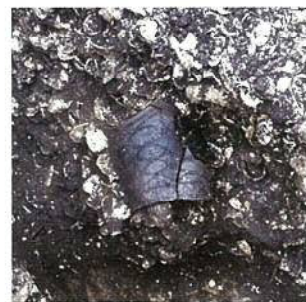
貝塚の中から 発見された土器 池田山北遺跡(東五反田) 平成2年(1990)