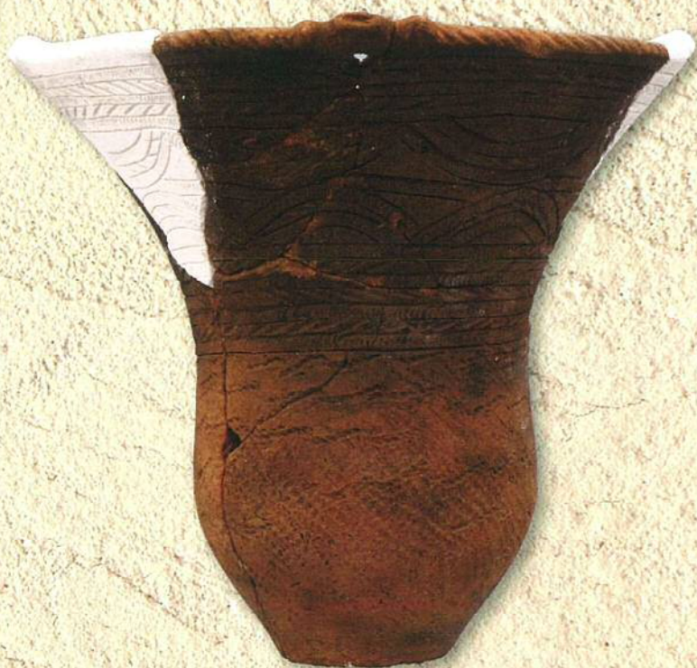
池田山北遺跡出土縄文土器 (縄文時代前期)