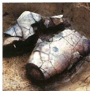
完形に近い状態で 発見された土器 居木橋遺跡(大崎) 平成6年(1994)