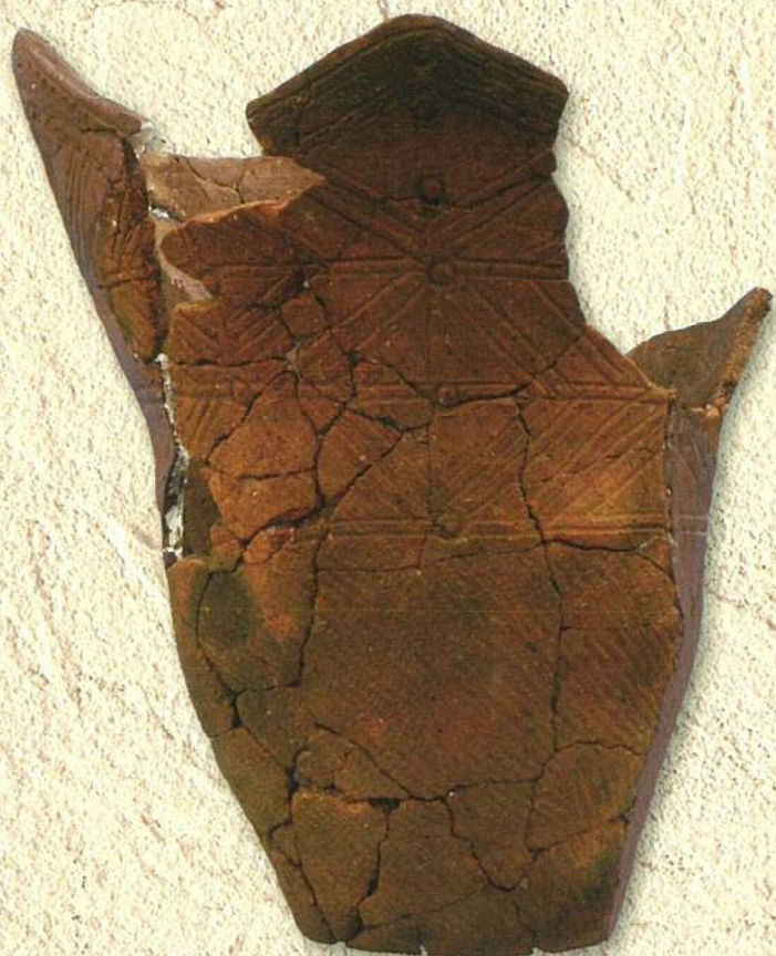
居木橋遺跡出土縄文土器 (縄文時代前期)