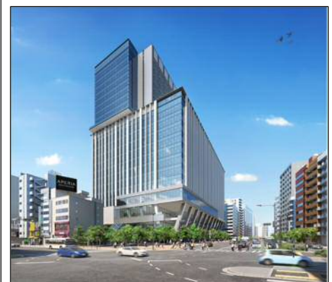
完成予想イメージパース