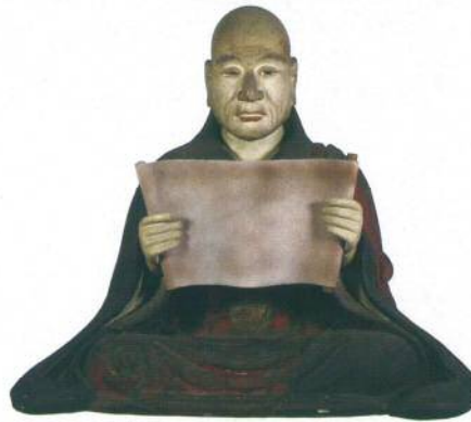
日什上人坐像(天妙国寺所蔵) 展示期間：通期