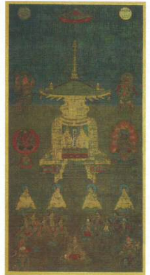
品川区指定文化財 宝塔絵曼荼羅(天妙国寺所蔵・当館寄託) 展示期間：10月6日～11月4日 (11月6日～12月1日 複製展示)