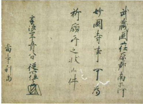
鎌倉公方足利成氏御教書(天妙国寺所蔵・当館寄託) 展示期間：10月6日～11月4日