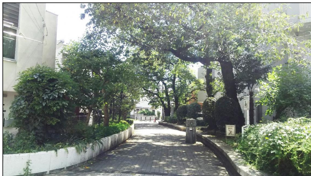
令和元年度工事箇所の現況