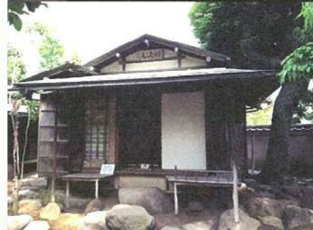
品川歴史館 茶室松滴庵