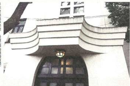
日本音楽高等学校1号館(旧池田菊苗邸)