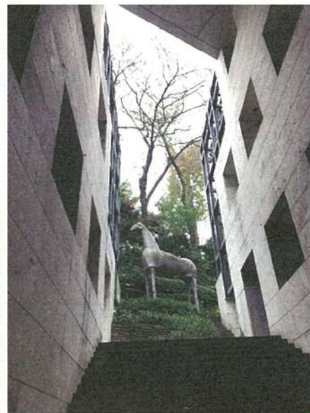
東京デザインセンター

www.city.shinagawa.tokyo.jp/PC/kankyo/kankyo-kenchiku/20190110102359.html