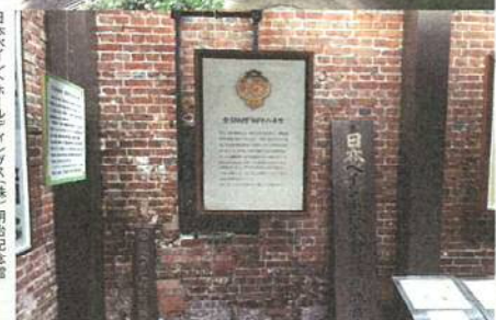
日本ペイントホールディングス(株) 明治記念館