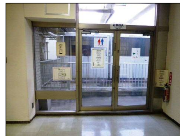
③ 第三庁舎 6階 喫煙所 屋外テラス