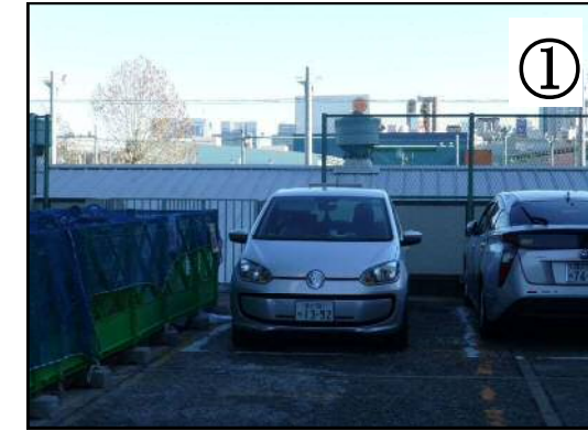
① 本庁舎・議会棟横 喫煙所 予定地 駐車場1台分を転用