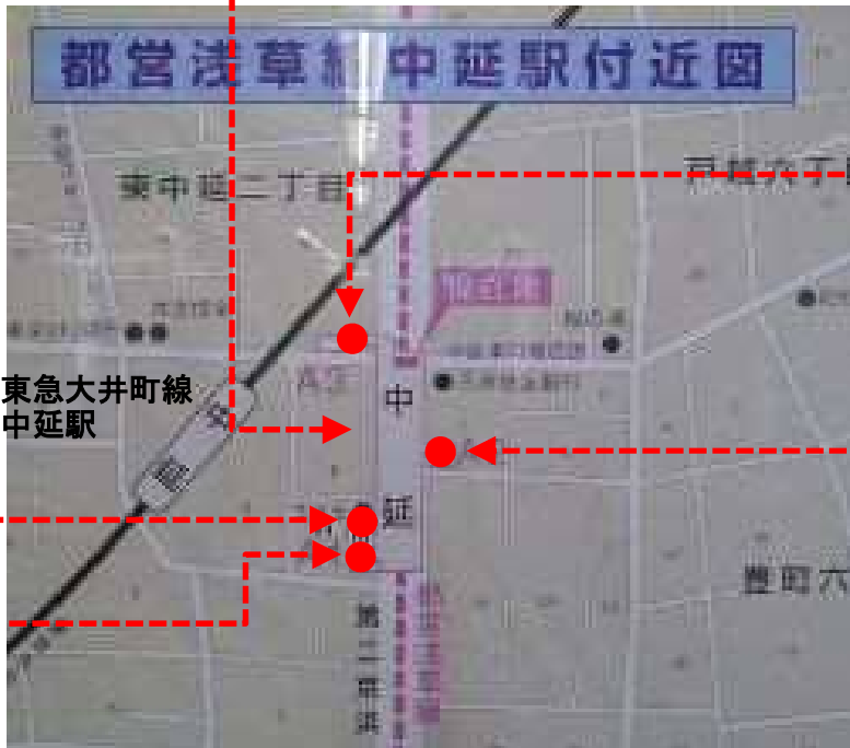
A1 出口 (階段) 中延 4～6 丁目