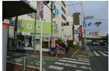
A3 出口 (階段) 東中延 1・2 丁目 中延 2～4 丁目 東急大井町線中延駅 乗り換え