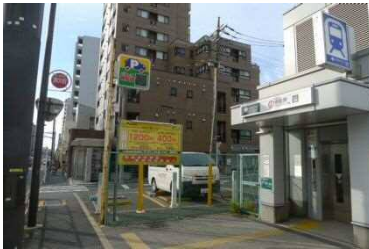
A4 出口 (エレベーター) 中延 4 丁目