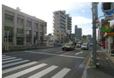
A3 出口～A4 出口間の 歩道の状況 (A3 出口～A4 出口の距離約 100m)