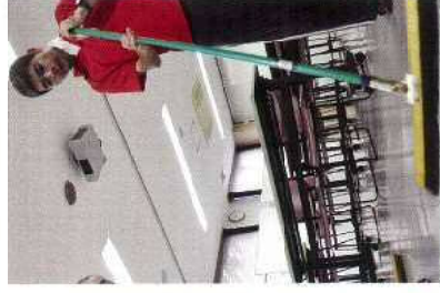
品川庁舎専ら専門学校の校内清掃