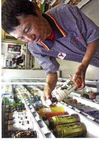
パソコンがふれあい売店販売作業