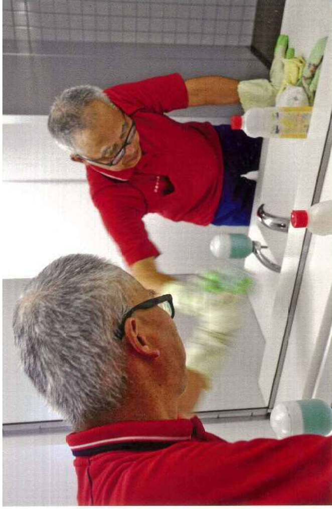
品川庁舎専ら専門学校の校内清掃

ふれあい作業所では、品川区内の公園清掃を行っています。四季折々でうつろう風景をいち早く感じられるのも清掃作業の醍醐味です。表紙のイラストは、春・桜咲き乱れる大井水神公園、夏・水面が光輝くしながわ花海運（高瀬園併工エリア）、秋・紅葉に彩られる大森貝島運動公園、冬・黄金色の兼吉が美しい大井坂下公園を描いたものです。