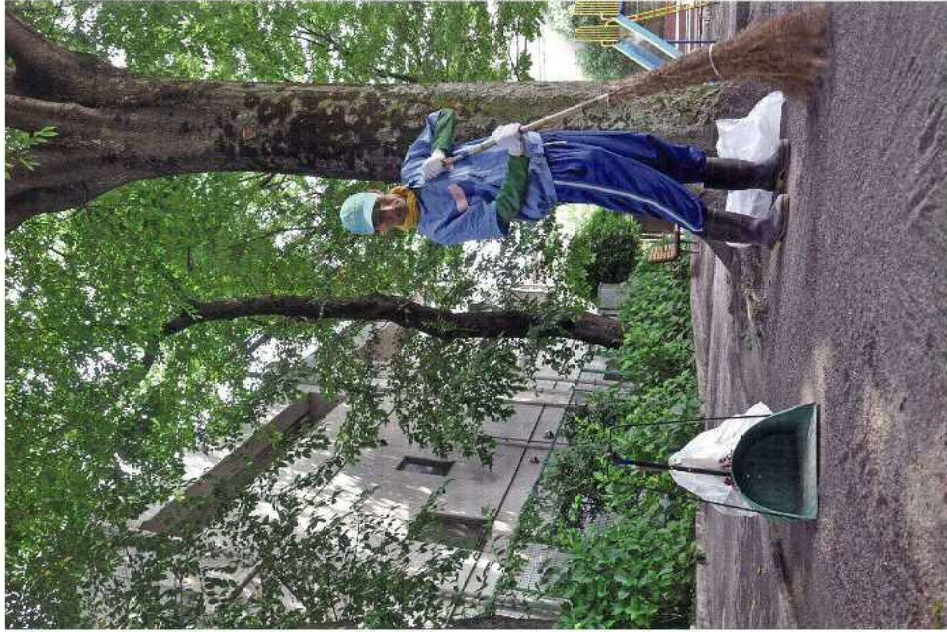
品川区公園にて公園清掃作業