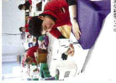
ミンシンの縫製作業