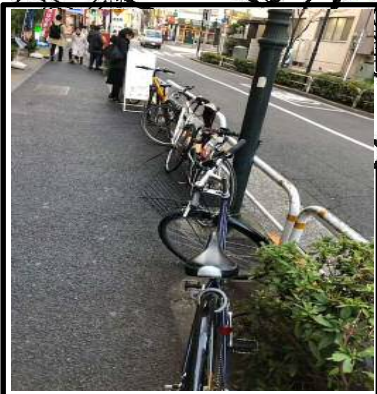
東五反田 1-18 付近の状況