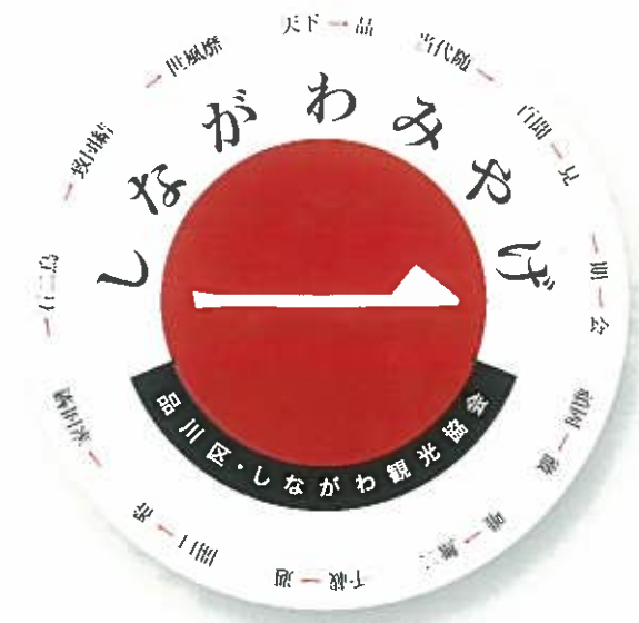
「しながわみやげ」認定マーク

しながわ観光大使「シナモロール」もしながわみやげを応援。「シナモロール」は遠いお空の雲の上で生まれた、白い子イヌの男の子。シッポがまるでシナモンロールのようにくるくる巻いているので、「シナモン」という愛称をつけてもらう。