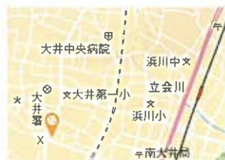
大井地区 最寄駅 立会川駅

※区政資料コーナー(品川区役所第三庁舎3階)でも販売しています。 電話:03-5742-6614(要確認)