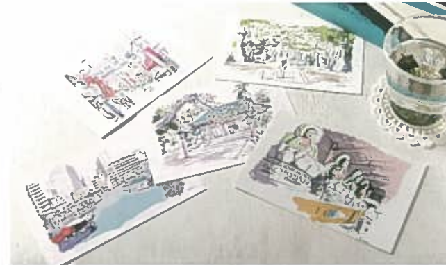
1枚 ¥150 (税込)