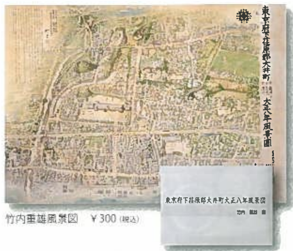
竹内重雄風景図 ¥300 (税込)