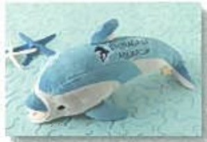
オリジナルイルカ ¥972 (税込)