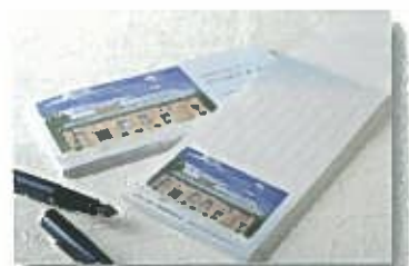
一筆箋 ¥200 (税込)