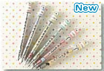
しながわ水族館限定 ¥432 (税込) おみくじ付 ボールペン、シャープペン