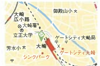
大崎地区 最寄駅 大崎駅

Pasco New Osaki 品川区大崎3-6-17 ニュー大崎ビル1F 電話 03-3494-1456 http://osakinishi.net/store01