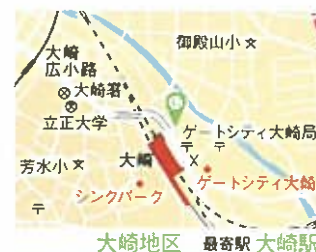
大崎地区 最寄駅 大崎駅

品川区大崎1-6-2 大崎ニューシティ2号館2F 電話 03-3495-4040 http://www.shinagawa-culture.or.jp/