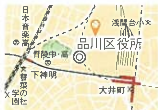
大井地区 最寄駅 大井町駅

品川区役所 品川区広町2-1-36 第三庁舎3階 区政資料コーナー 電話 03-5742-6614