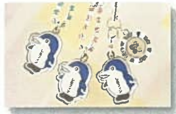
しなフィンのストラップ ¥378 (税込) ラインストーンアクセサリ(ピンク・ブルー) くるくるまわる幸運のクローバー