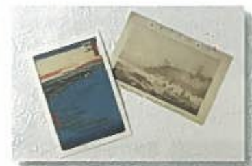
絵はがき 各¥50 (税込)