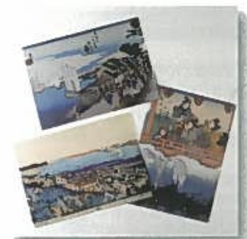
クリアファイル 各¥200 (税込)