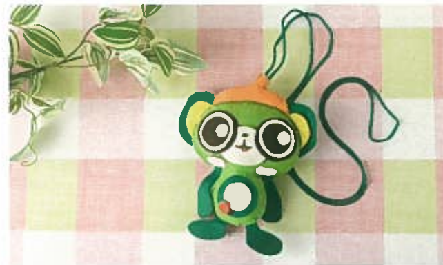
1個 ¥1,458 (税込)