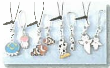
ストラップ ¥432 (税込) チンアナゴ・カクレクマノミ・クリオネ・ミミズクダ