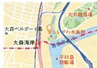
大井地区 最寄駅 大森海岸駅

しながわ水族館 マリンショップ「シーガル」 品川区勝島3-2-1 電話 03-3768-2114 http://www.aquarium.gr.jp/