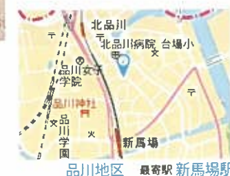
品川地区 最寄駅 新馬場駅

創業明治28年宿場町品川の最高のお土産品として代々受け継がれた「あきおかの手焼きせんべい」は、昔も今も皆様に親しまれる逸品。