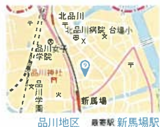
品川地区 最寄駅 新馬場駅

江戸の香りを残す東海道品川宿、品川神社のそばで50年、創業以来変わらぬ味を大切に、名物の将棋の駒形堅焼きせんべい。保存料なしの特撰醤油で一枚ずつ手焼きしてさっぱりとした味付け。堅焼、海苔、ごま、青のり、うす焼きとバラエティも豊富。