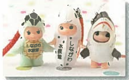
しながわ水族館限定キュービー ¥540 (税込) ウミガメキュービー・チンアナゴキュービー・サメキュービー