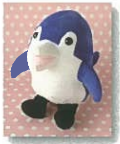
しなフィンぬいぐるみ ¥1,620 (税込)