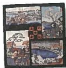
ハンカチ ¥300 (税込)

品川区立 品川歴史館 品川区大井6-11-1 電話 03-3777-4060 http://www.city.shinagawa.tokyo.jp/jigyo/06/historyhp/hsindex.html