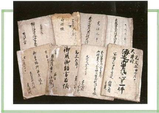
上大崎村名主竹内家文書 品川区指定文化財 (当館所蔵)

JR山手線の駅で知られる大崎・五反田地域は、品川区を横断する目黒川と、同じく縦断する中原街道沿いに発展してきた歴史の古いまちです。現在の大崎・五反田地域は、江戸時代、主に かみおおさき 上大崎村・ やま 下大崎村・ やま 谷山村・ きりがや 桐ヶ谷村・ いるぎぼし 居木橋村・ だいまち 品川台町・ ながみねとう 永峯町・ ろっけんちや 六軒茶屋町で構成されていました。この地域は、徳川幕府の直轄領として将軍の鷹場に指定されたほか、将軍家の菩提寺・増上寺の下屋敷や多くの寺社、松江藩や鳥取藩、岡山藩といった諸大名の屋敷が展開されました。幕府直轄領は現在の品川区全域を網羅するものですが、なかでも大崎・五反田地域はここ10年近世文書の発見が相次いでおり、村々の様子を知ることができるようになりました。そこで本展では、村・寺社と門前町・大名屋敷の3つの視点から、江戸時代の大崎・五反田を紹介します。