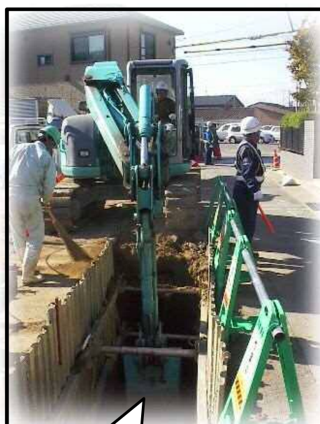
開削工法（布設替え）