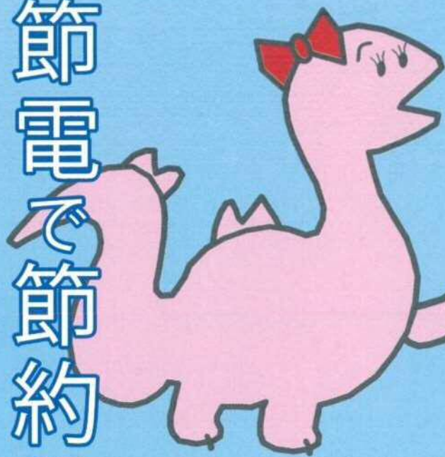
エコラ 品川区環境キャラクター