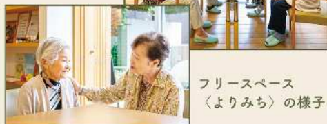
フリースペース「よりみち」の様子