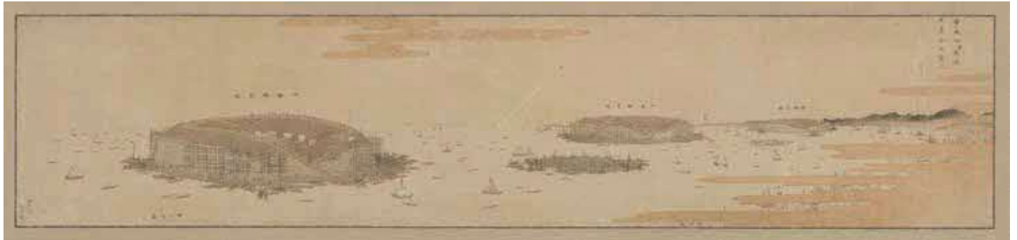
「江戸湾品川沖御台場御普請絵図」 1854(嘉永7)年5月10日(当館所蔵)