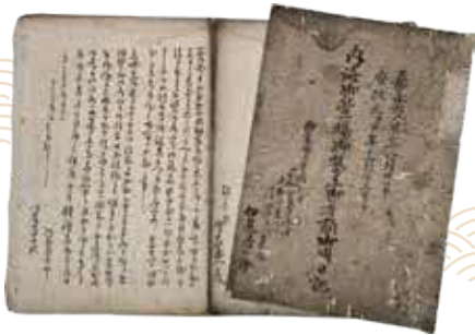
伊藤清一郎筆「内海御台場御築立御普請御用日記」 1853~54(嘉永6~7)年 下蛇窪村名主伊藤家文書(当館所蔵)