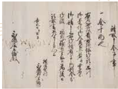
「請取申金子之事(金千両請取)」 1854(嘉永7)年 三浦郡公郷村永嶋家文書