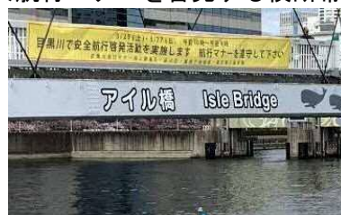
<航行マナーを啓発する横断幕>