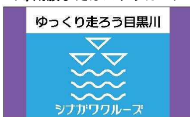
<専用旗またはステッカー>