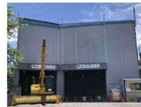
写真：子供の森公園隣接地（下流部発進）の状況