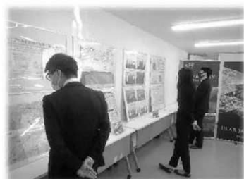
説明パネルのイメージ