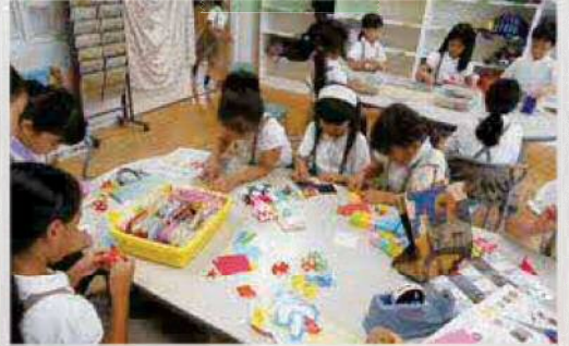
ユニット折り紙に夢中

クラスや学年を超えた子どもたちが、共に遊んだり、読書したり、学習したりと自由に過ごす時間です。活動場所は、すまいるスクールのスペースのほか、校庭や体育館、特別教室などです。