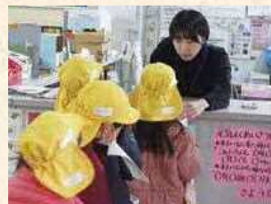
保育園児のすまいるスクール体験