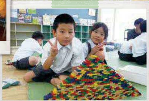
ドミノを慎重に積み上げました!