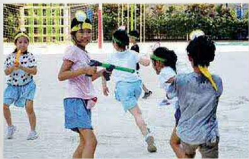
夏はやっぱりウォーターバトル

子どもたちが様々な体験をする場です。日本の伝統文化、スポーツ、環境や音楽などの情操教育、ものづくりの教室など、様々な教室が行われています。