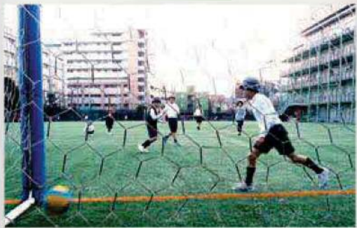
人工芝の校庭でサッカー

クラスや学年を超えた子どもたちが、共に遊んだり、読書したり、学習したりと自由に過ごす時間です。活動場所は、すまいるスクールのスペースのほか、校庭や体育館、特別教室などです。