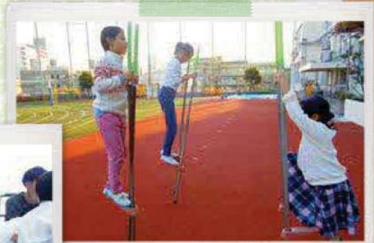
竹馬でバランス感覚バッチリ!