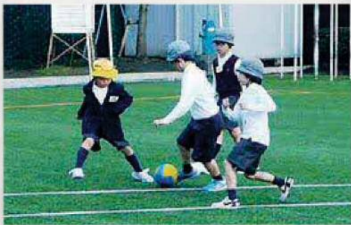
友達と競い合い、育ち合う!