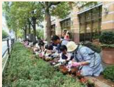
花いっぱいになろう!