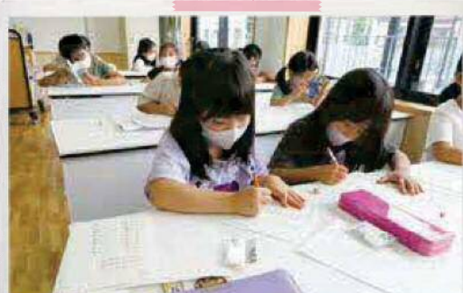
みんなで宿題終わらせちゃおう!