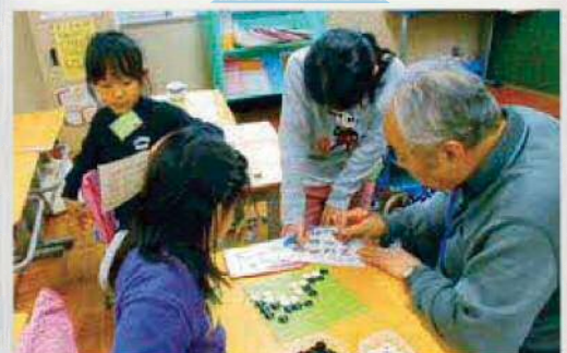
伝統文化を体験 ～囲碁教室～

これらの教室は、地域ボランティア、PTAの方々などの協力のほか、すまいるスクール指導員の企画により実施されています。発表会やお楽しみ会などのイベントもあります。