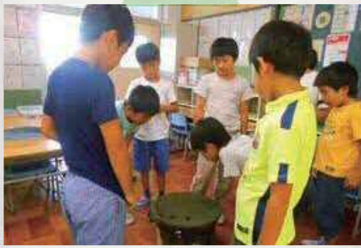
ベーゴマ勝負。勝つのは誰だ!