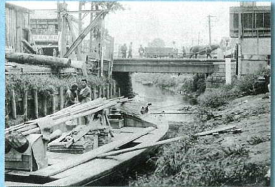
大正14年(1925)の大崎橋と目黒川(当館所蔵) 展示期間10月9日(土)～12月5日(日) 通期パネル展示