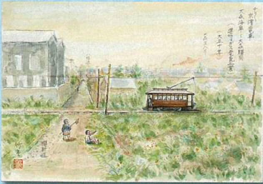
竹内重雄「チンチン京浜電車 大森海岸～大森駅間 (建物はガス電気工業) (大正十年)」(当館所蔵) 展示期間10月9日(土)～11月4日(木) ※11月5日～12月5日は複製展示

近年の品川の歩みと風景の変貌ぶりには目を見張るものがあります。本展では、変わりゆく品川に視点を当てて、江戸から昭和までの時代の中で、品川の風景がどのように変化したのか、浮世絵や近代版画といった絵画や写真などの資料を使ってお届けいたします。