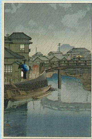
川瀬巴水「品川」 (当館所蔵) 展示期間11月12日(金) ～12月5日(日)

●新型コロナウイルスの感染拡大防止にご協力ください ご観覧にあたり、マスク着用・手指の消毒・検温をお願いします。 観覧中に体調不良を感じた方は受付へお申し出ください。