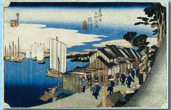
歌川広重初代「東海道五拾三次之内 品川 日之出」 (当館所蔵) 展示期間10月9日(土)～10月22日(金)