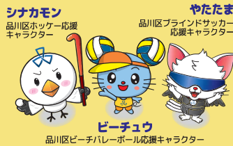
シナカモン 品川区ホッケー応援 キャラクター

品川区では、東京2020オリンピック・パラリンピックの競技のうち、区内開催のホッケー、ビーチバレーボールと応援競技としてブラインドサッカーの3競技を応援しています。皆さんとともに3競技を応援し、盛り上げていくことが彼らの使命です。