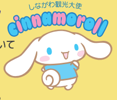
しながわ観光大使

遠いお空の雲の上で生まれた、白いこいぬの男の子。シッポがまるでシナモンロールのようにくるくる巻いているので、「シナモン」という名前をつけてもらう。今は、カフェの看板犬として活躍中。特技は、大きな耳をパタパタさせて、空を飛ぶこと。2017年2月から、しながわ観光大使を務めています。