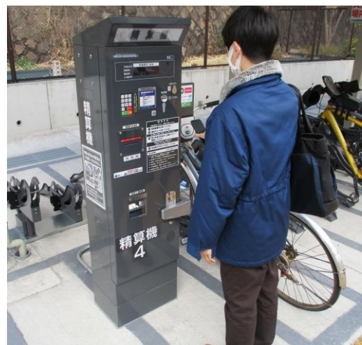
<スマートフォンによる支払いイメージ>