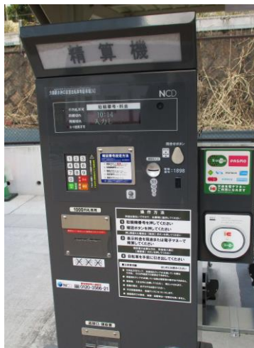
<現金及びICカード対応精算機>