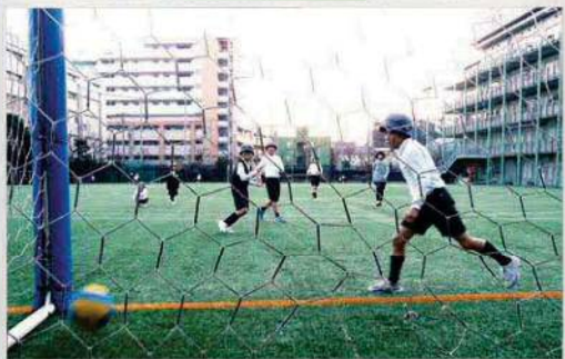
人工芝の校庭でサッカー

クラスや学年を超えた子どもたちが、共に遊んだり、読書したり、学習したりと自由に過ごす時間です。活動場所は、すまいるスクールのスペースのほか、校庭や体育館、特別教室などです。