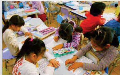
みんなで宿題終わらせちゃおう!