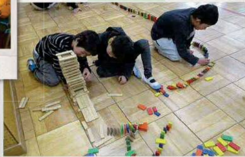
すごいコースになったね