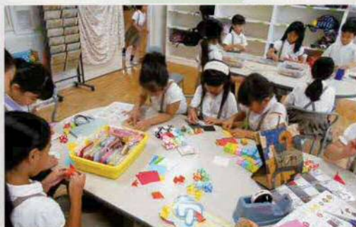
ユニット折り紙に夢中

クラスや学年を超えた子どもたちが、共に遊んだり、読書したり、学習したりと自由に過ごす時間です。活動場所は、すまいるスクールのスペースのほか、校庭や体育館、特別教室などです。