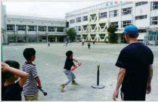
フルスイング! ～野球(ティーボール)教室～