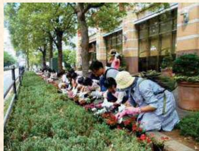
花いっぱいにしてよう!