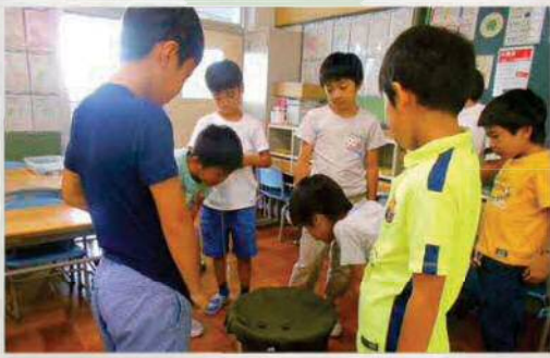
ベーゴマ勝負。勝つのは誰だ!