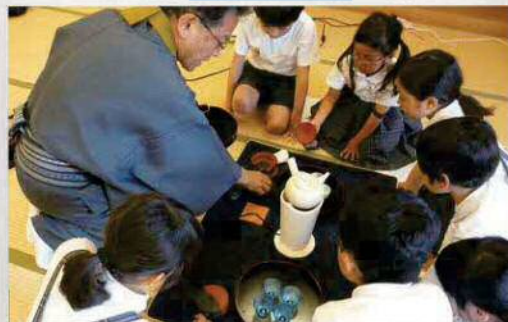
伝統文化を体験 ～茶道教室～