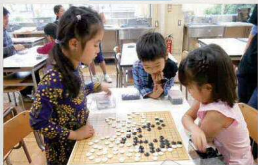
この一手でどうだ？ ～囲碁教室～

子どもたちが様々な体験をする場です。日本の伝統文化、スポーツ環境や音楽などの情操教育、ものづくりの教室など、様々な教室が行われています。