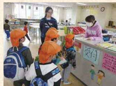
保育園児のすまいるスクール体験