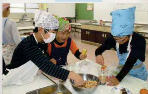
おいしく作ろうね ～クッキング教室～

これらの教室は、地域ボランティア、PTAの方々などの協力のほか、すまいるスクール指導員の企画により実施されています。発表会やお楽しみ会などのイベントもあります。