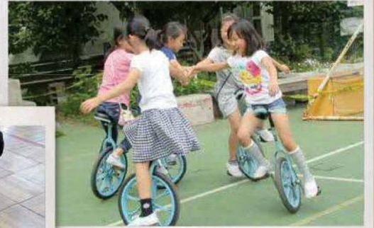
5人メリーゴーランド大成功!