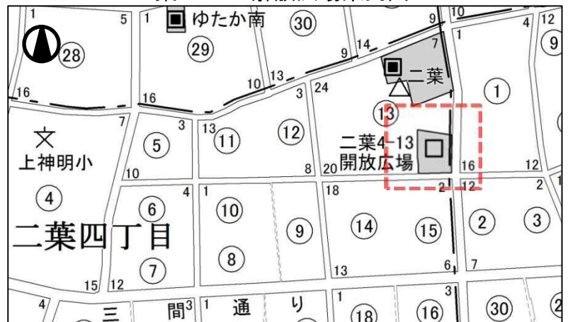
二葉4-13 開放広場案内図

日にち : 令和2年7月13日(月) 場 所 : 大井第三地域センター 区民集会所 対象範囲: 近隣住民、町会、自治会、 商店会の長ならびに まちづくり協議会の 代表者 電波障害を受けると 認められる者