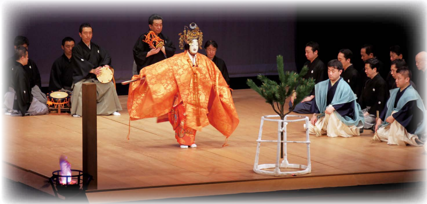
東京2020公認文化オリンピック「品川薪能」(5月28日きゅりあんにて)

品川区議会のホームページアドレス http://gikai.city.shinagawa.tokyo.jp/