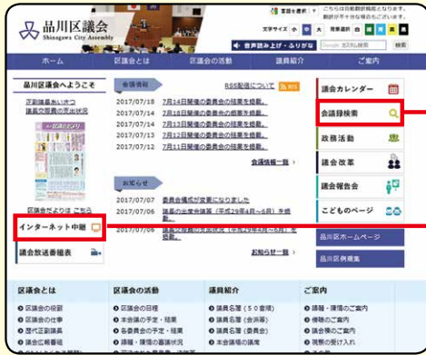
パソコン(トップ画面)