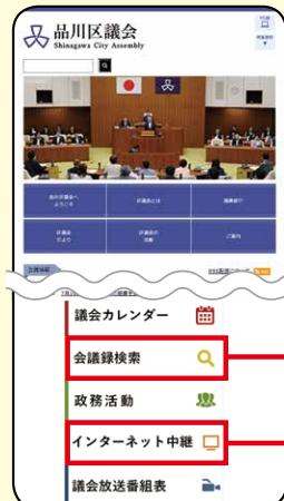
スマートフォン(トップ画面)