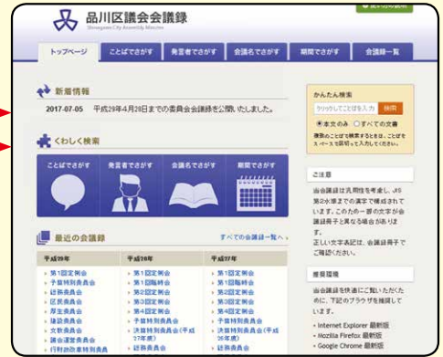
会議録の検索画面

平成29年9月から、スマートフォン・タブレット端末でもインターネット中継が見られるようになりました!