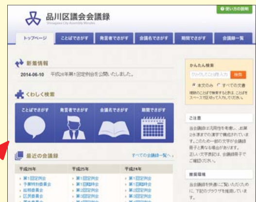
(会議録の検索画面)