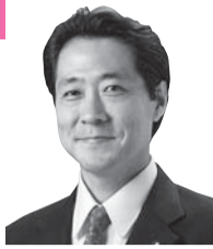
本多 健信 議員 (自民)

区長 ①現在2件の工事で活用している。②研究していく。③国の通知を踏まえ、準備が整い次第、新労務単価を適用する予定だ。④都が工事発注を行うが、業者選定方法も含め未定と聞いている。区が受託する場合は、区内事業者への優先的な発注を行う。