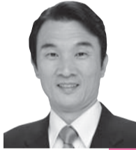
浅野ひろき 議員 (公明)