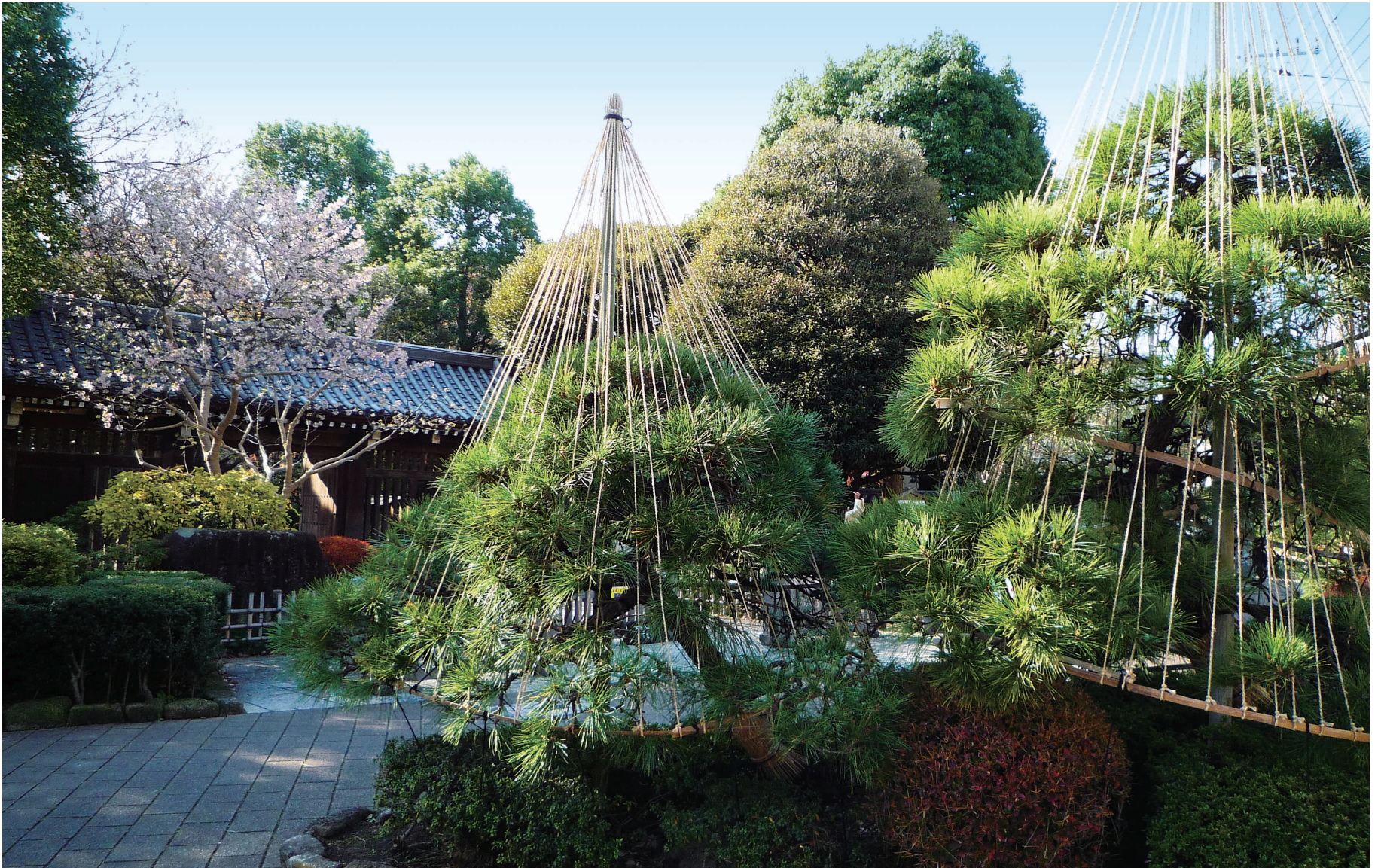
戸越公園 松の雪つり

品川区議会のホームページアドレス http://www.city.shinagawa.tokyo.jp/kugikai/index.html