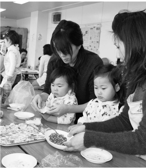
世界の子ども料理を作ろう(旗の台児童センター)

①昨年来、区内部の組織が揺らいでいるのではないかと感じる。計算、査定や執行等のさまざまな時点において、多角的に検証する行為が欠けたと思われる事例があった。一たん事が起きたときの状況の中で連絡方法や報告体制など欠けていたことはないのか。一刻も早い建て直しを打ち出し、区民の信頼を万全なものにしてほしいが、決意を伺う。②生涯学習課の業務を部分的に区長部局へ移したほうが、より教育委員会の実力が発揮され、さまざまな事業も区民との協働によりスムーズに行われるのではないのか。