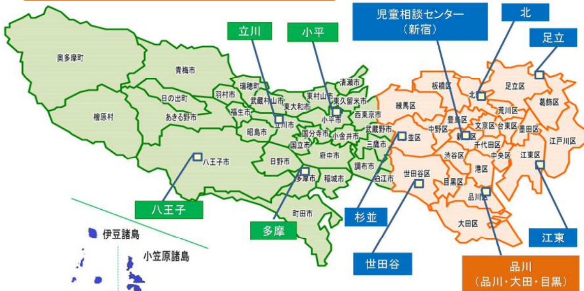
特別区内にある児童相談所